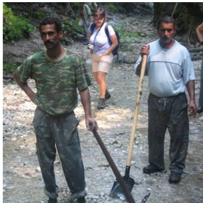
Opravári chodníkov v akcii