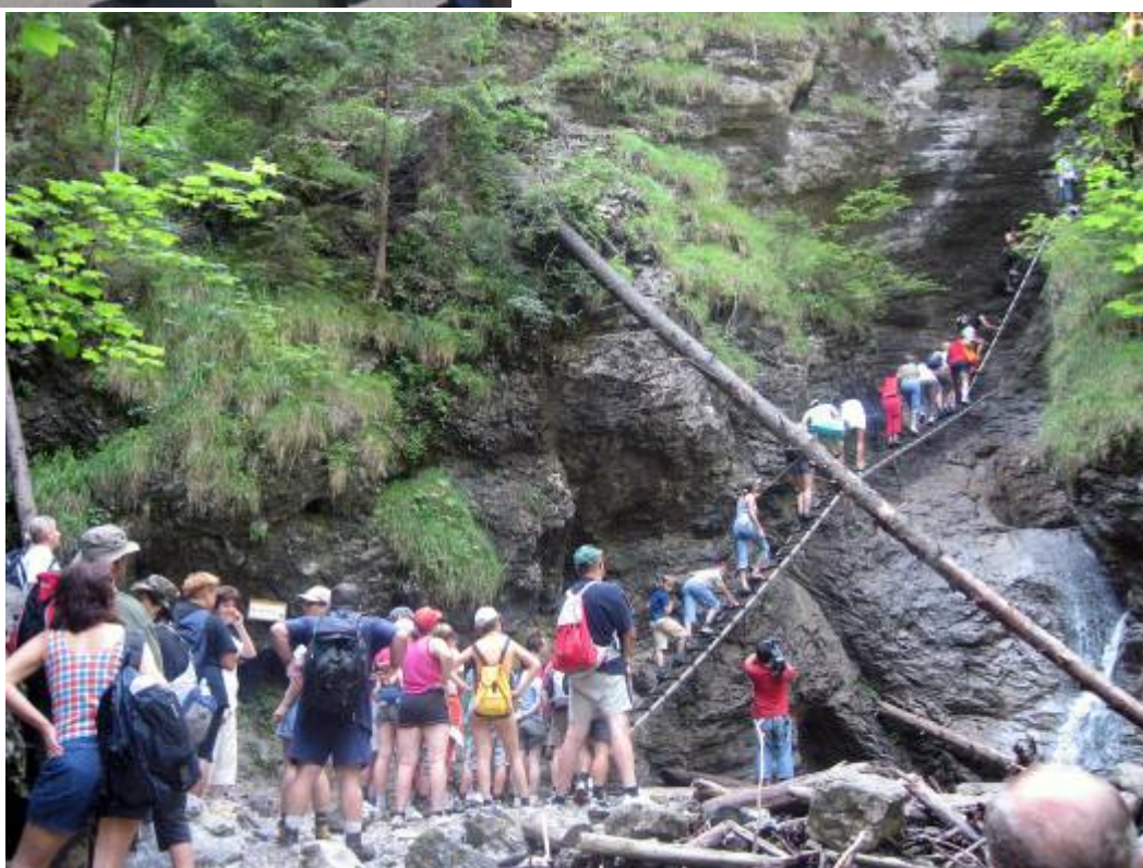
Suchá Belá v hlavnej turistickej sezóne