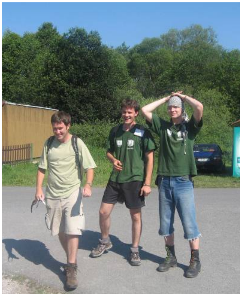
Skautská strážna služba