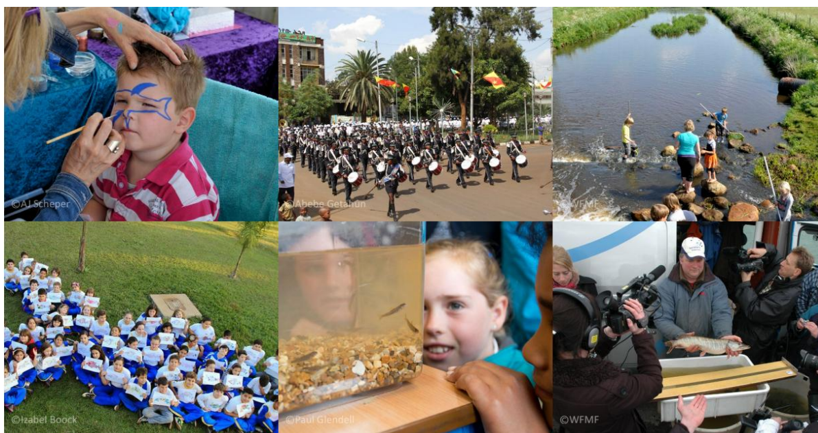
Podujatia k SDMR 2014

Milióny ľudí na celom svete sú odkázané na sladkovodné druhy migrujúcich rýb, ktoré predstavujú hlavný zdroj ich stravy a obživy. Napríklad až 50 miliónov ľudí je svojou stravou a živobytím závislých na rieke Mekong. V iných oblastiach migrujúce ryby a ich potomstvo predstavujú dôležitý zdroj potravy pre iné druhy sladkovodných a morských rýb dôležitých z ekologického hľadiska a pre komerčné využite. Kolaps mnohých populácií rýb má devastačný vplyv na potravinovú bezpečnosť týchto ľudí a milióny najchudobnejších obyvateľov sveta.